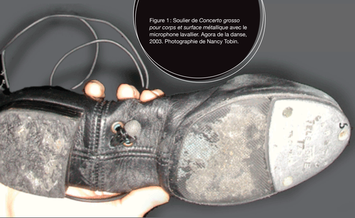
Figure 1 : Soulier de Concerto grosso pour corps et surface métallique avec le microphone lavallier. Agora de la danse, 2003.